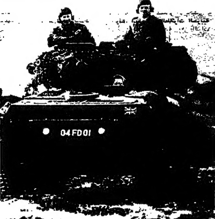
فوج مصحة سكوريون، الاميرة ان تتجج في الامتحان